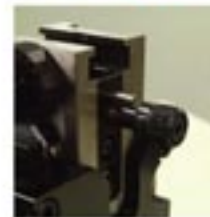
Wire C/H Dial