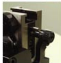
线芯部分压接高度调节