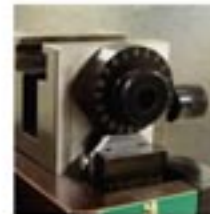
Insulation C/H Dial

The HDE is one of Tyco quality applicator families which works with JAM-style crimping machines generally available in Asia. The HDE has precision and wide-range crimp height dials for wire and insulation. This crimp height adjustment function provides wider crimping machine selection and easier crimp quality management at harness making processes.