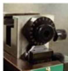
绝缘部分压接高度调节

HDE 是泰科优质模具家族中的一员，它可使用于通常在亚洲应用的JAM类型的端子机上。HDE模具对线芯及绝缘部分均拥有精确及范围宽广的压接高度调节盘。该高度调整功能提供了线束加工中更宽广的压接机器选择范围，以及更容易的压接质量管理。